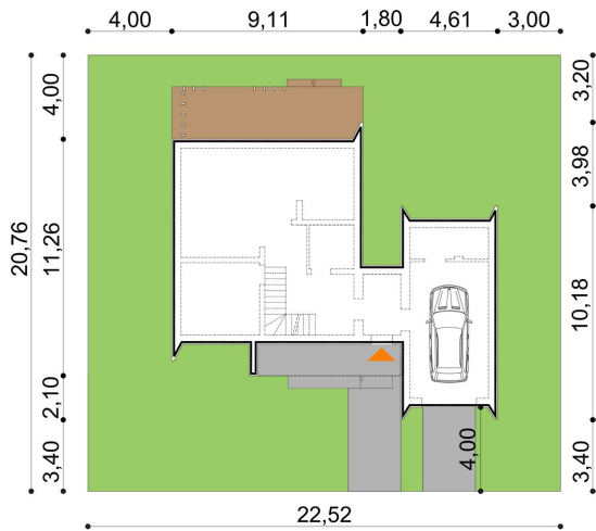
KOMPAKTOWY 02 B 139,80 m 2 minimalne wymiary działki